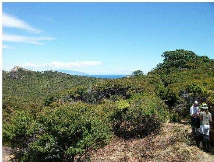
Wild wachsende Manuka Sträucher in intakter Natur!

Jürg Flückiger, +43 699 186 946 07, jef@manuka-honig.biz www.manuka-honig.biz